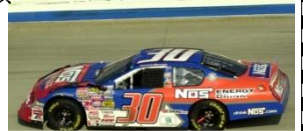
INTERUSH 贊助車款 4