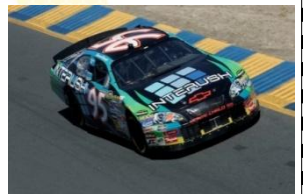
INTERUSH 贊助車款 3

NASCAR 儼然已經成為贊助商及電視公司的搖錢樹。NASCAR 車迷獨特的向心力、賽車現場令人屏息的感官刺激，讓 NASCAR 有別於其他賽車活動，獨步全球！