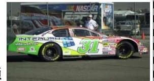
INTERUSH 贊助車款 2