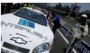
INTERUSH 最新賽車 白色車身十分亮眼