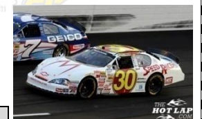
INTERUSH 與 駭速快手 共同贊助